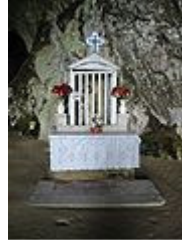
Edicola votiva a San Michele Arcangelo