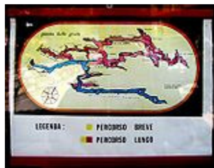
Mappa delle grotte