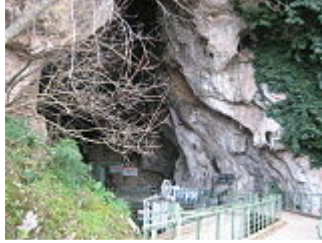
Ingresso alle grotte