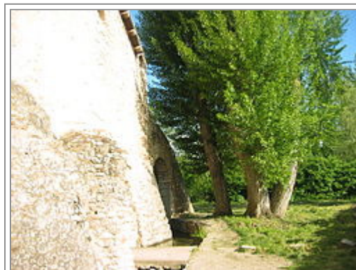
Località "Fonti", Battistero di San Giovanni